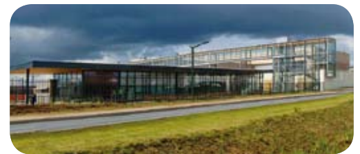
Centre de Valorisation Organique - Lille

À Göteborg, dès 1999, Göteborg Energi injectait un biogaz non épuré dans le réseau urbain qui accueillait déjà du gaz dit gaz de ville. En 2006, elle décide d'injecter du biogaz épuré dans le réseau de